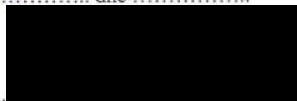
Renáta Dubová jednatelka společnosti

VAREPO J.R.O. © VELKOOBCHOD POTRAVIN Průmyslová 205 • 391 37 Chotoviny IČ: 07826151 • DIČ: CZ07826151 tel.: +420 381 252 931