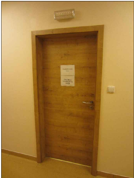
VNITŘNÍ DŘEVĚNÉ DVEŘE POPIS VIZ VÝPIS VÝPLNÍ OTVORŮ