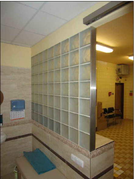
ST1 ST2 LUXFEROVÁ STĚNA POPIS VIZ VÝPIS PRVKŮ