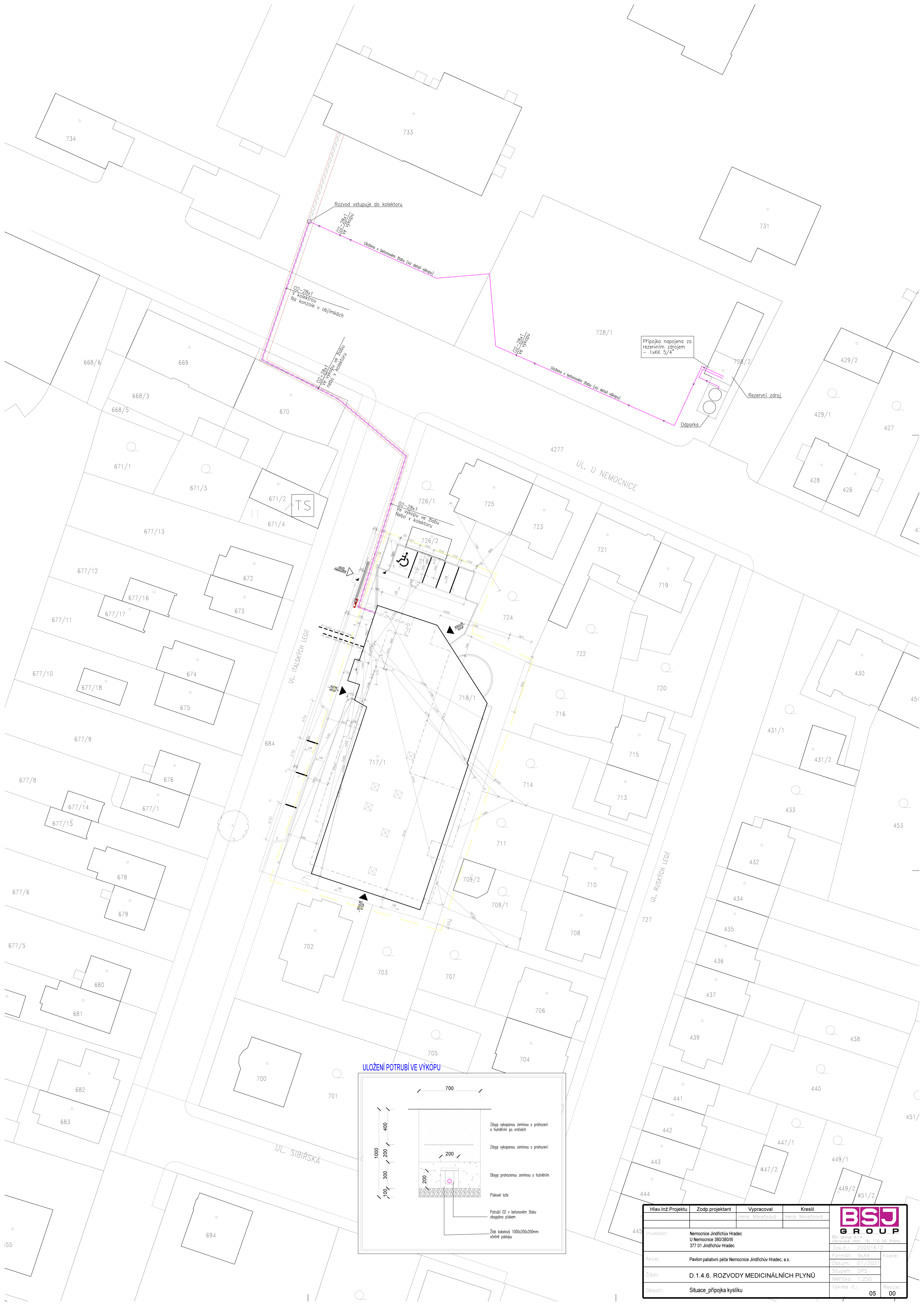
ULOŽENÍ POTRUBÍ VE VÝKOPU