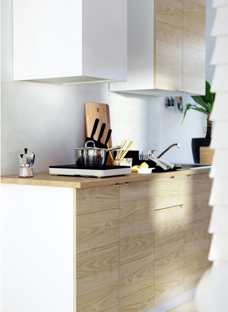
KUCHYŇSKÁ LINKA S DVÍŘKY BÍLÁ MATNÁ / BÍLÝ KORPUS